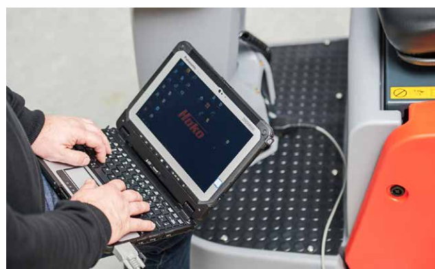
Fácil acceso a la interfaz de diagnóstico con fines de mantenimiento y para modificar la configuración de la máquina.

Blue Competence es una iniciativa dirigida por la asociación alemana de ingeniería industrial. Adoptando la insignia Blue Competence, Hako se compromete con las doce pautas de sostenibilidad de la Industria de Ingeniería Mecánica: www.bluecompetence.net/about